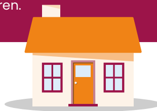
Huurprijs per maand in euro's

Tot welke huurprijs u een woning mag huren, hangt af van het aantal mensen waarmee u wilt samenwonen en uw inkomen. In dit schema ziet u tot welke huurprijs u een woning mag huren.