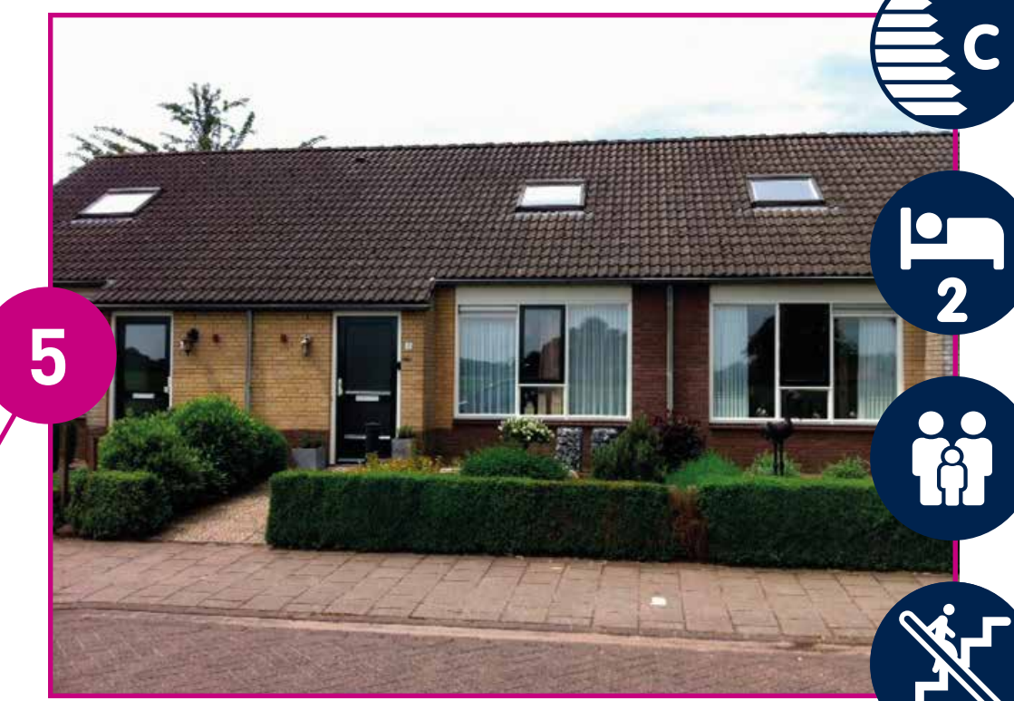
BEUMWEG VANAF € 544,-