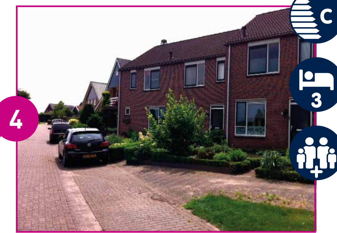
PASTOOR REIBERSTRAAT VANAF € 548,-