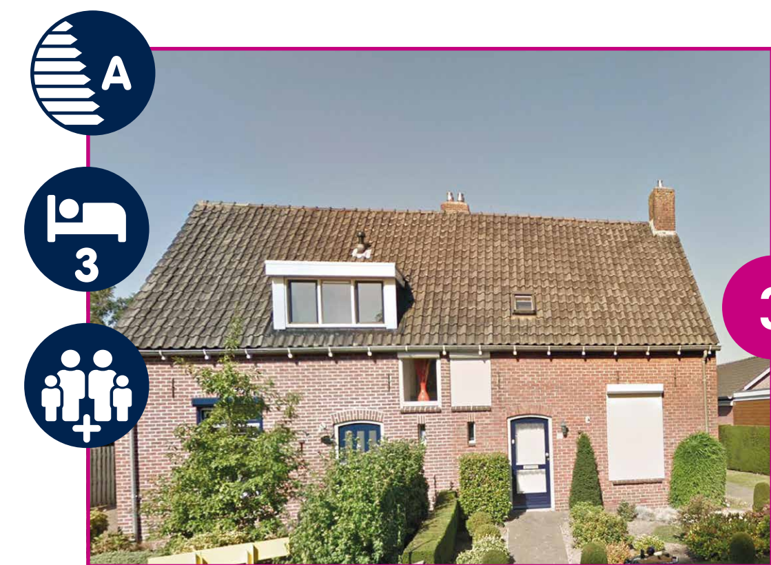
WINTERSWIJKSEWEG VANAF € 548,-