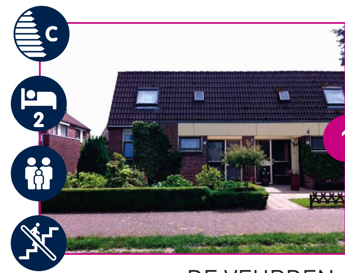
DE VEURDEN VANAF € 480,-