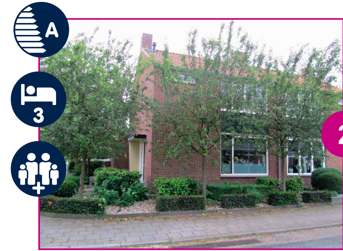
SIEVERDINGWEG VANAF € 605,-